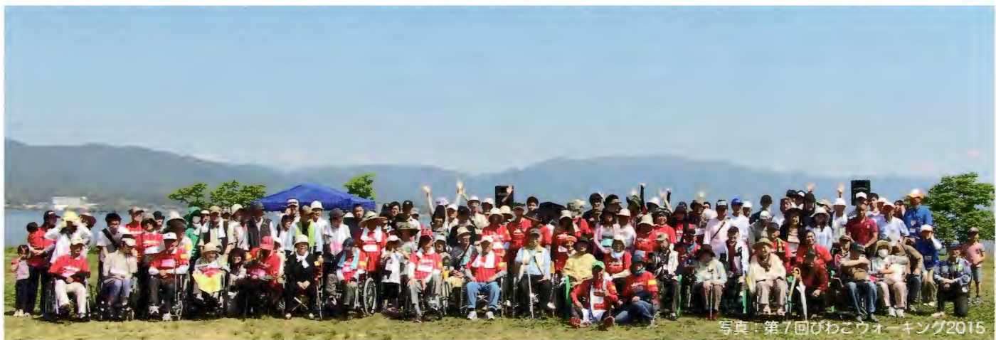
写真：第7回びわこウォーキング2015